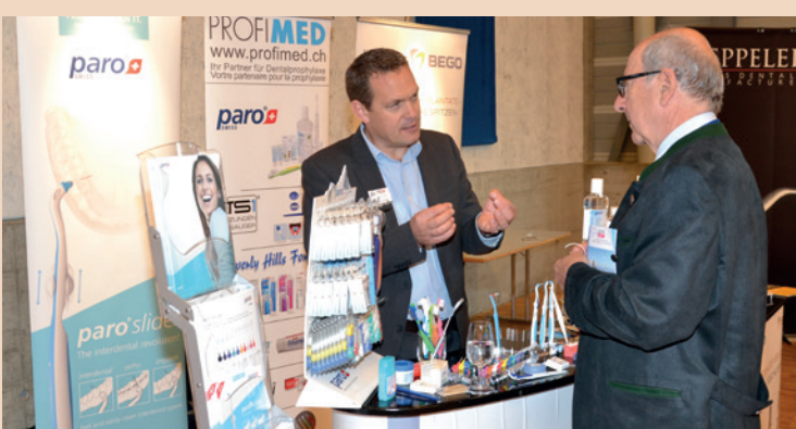
Fachlicher Austausch in der Dentalausstellung.

Info-Anforderung für Fachkreise Fax: 0451 - 304 179 oder E-Mail: info@hypo-a.de