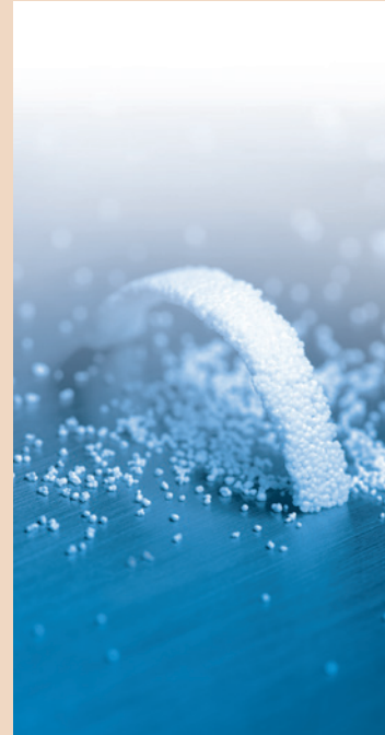
GUIDOR® easy-graft, das bioresorbierbare, alloplastische Knochenersatzmaterial.

Herr Kupferer, welche Bedeutung hat die Schweiz für den Sunstar Konzern und welche Möglichkeiten bieten sich für die Business Unit GUIDOR?