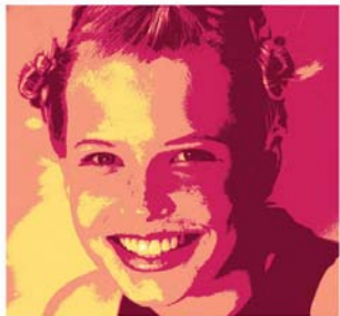
Ich mag meine schönen und gesunden Zähne