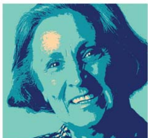
Zuverlässige Zähne sind für mich Lebensqualität