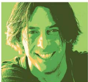
Kraftvolles Zahnfleisch ist mir wichtig