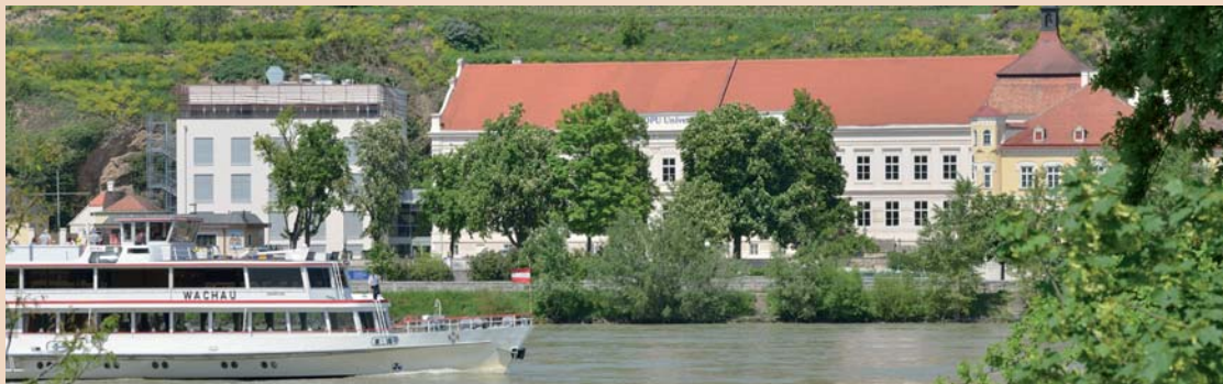
Der Hauptsitz der Danube Private University mit angrenzendem Zahnambulatorium Krems der Danube Private University (Neubau).

DPU graduierte 4.000 Zahnärzte aus 42 Nationen zum Master of Science.