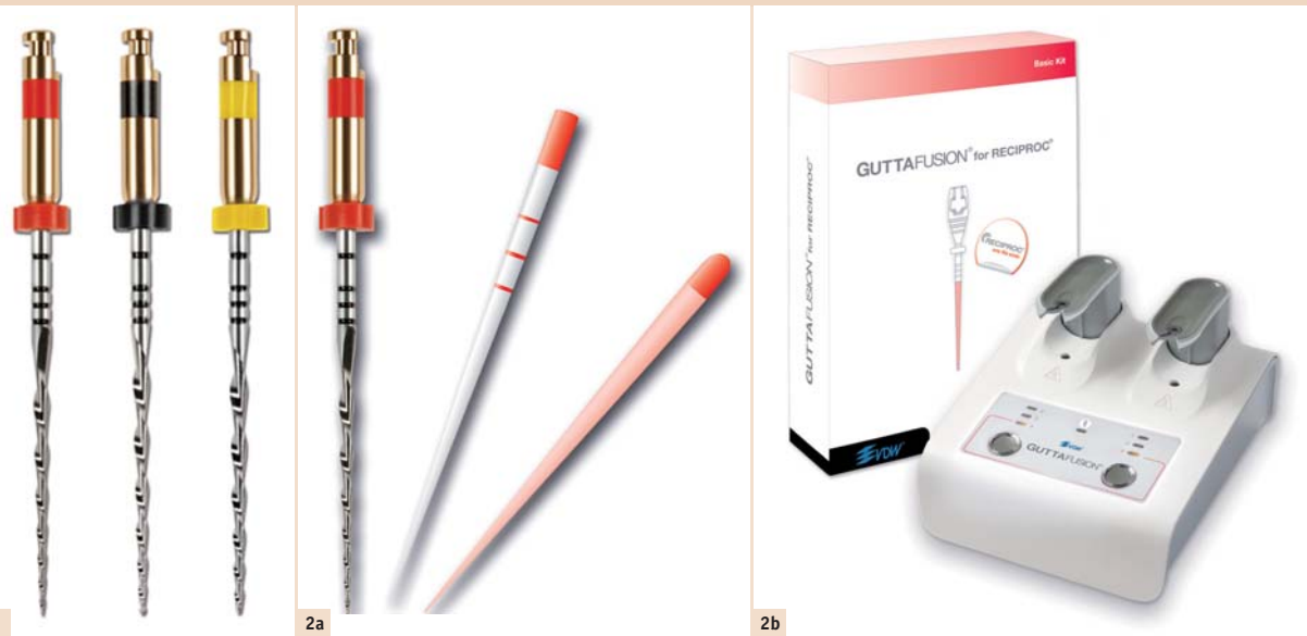
Abb. 1: RECI-PROC®-Instrumentenset. – Abb. 2a: RECI-PROC®-Set: Instrument, Papier- und Guttaperchaspitze, hier Spitzendurchmesser 0,25 mm. – Abb. 2b: Trägerbasiertes Obturationssystem abgestimmt für RECI-PROC®-Instrumente.

gang und die mangelnde Sicht der zu behandelnden Bereiche, die komplizierte Kanalanatomie – wie z. B. Einengungen, Obliterationen und Kanalkrümmungen, die eingeschränkte Erreichbarkeit aller Kanalwandbereiche durch die Wurzelkanalinstrumente mit daraus resultierender insuffizienter Reduktion der bakteriellen Kontamination, sowie die oft mangelnde Effizienz in der Formgebung durch die mechanische Kanalaufbereitung, welche auch eine erschwerte Wurzelkanalfüllung mit nicht ausreichender bakteriendichter Versiegelung des desinfizierten Kanalsystems nach sich zieht.