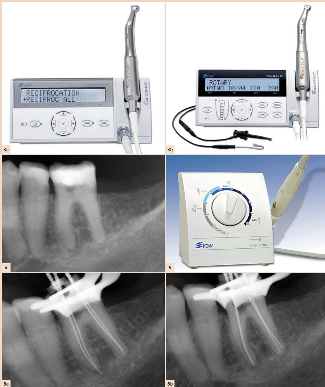
Abb. 3a: VDW.SILVER® RECIPROC® Motor. – Abb. 3b: VDW.GOLD® RECIPROC® Motor – mehr Bedienungsoptionen und integrierte elektrometrische Längenbestimmungsmöglichkeit. – Abb. 4: Zahn 36 Übersichtsaufnahme, orthoradial. – Abb. 5: Ultraschallgerät VDW.ULTRA®. – Abb. 6a: Orthoradiale Messaufnahme – leichte Überinstrumentierung mesial. – Abb. 6b: Exzentrische Messaufnahme – Korrektur der mesialen Arbeitslänge.

Durch Anwendung moderner Hilfsmittel – von der diagnostischen Phase bis zur Obturation – kann die endodontische Therapie eine gute Vorhersagbarkeit und Erfolgsquote erreichen. Der Zahnerhalt stellt somit eine solide Behandlungsalternative dar. IT