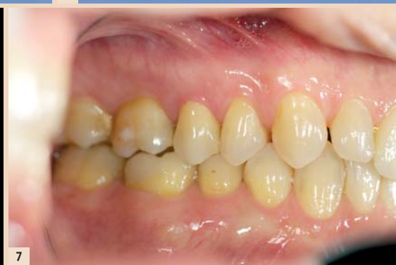
Abb. 1: Substanzschonend wurde die insuffiziente Metallkeramikkrone entfernt ... – Abb. 2: ... und eine keramikgerechte Stufenpräparation mit abgerundetem Innenwinkel angelegt. – Abb. 3: Virtuelle Konstruktion nach digitaler Abdrucknahme. – Abb. 4: Die Krone kann in allen drei Dimensionen verschoben werden, ... – Abb. 5: ... um eine optimale Farbwirkung als Resultat des richtigen Verhältnisses von Dentin- und Schmelzanteil zu erzielen. – Abb. 6: Aus VITABLOCS RealLife geschliffene Krone. – Abb. 7: Endergebnis.

Bei der Entwicklung von VITABLOCS RealLife wurde auf die klinisch bewährte VITABLOCS Mark II-Keramik zurückgegriffen, aus der seit 1990 über 20 Millionen Restaurationen mit klinischen Erfolgsraten von über 90 Prozent bei Inlays, Onlays und Kronen gefertigt wurden. Kombiniert wurde dies mit einem neuartigen geometrischen Aufbau, der in seiner Schichtstruktur den natürlichen Zahnaufbau nachbildet. Entwickelt wurde das innovative Blockkonzept speziell für hochästhetische Frontzahnrestaurationen in Form