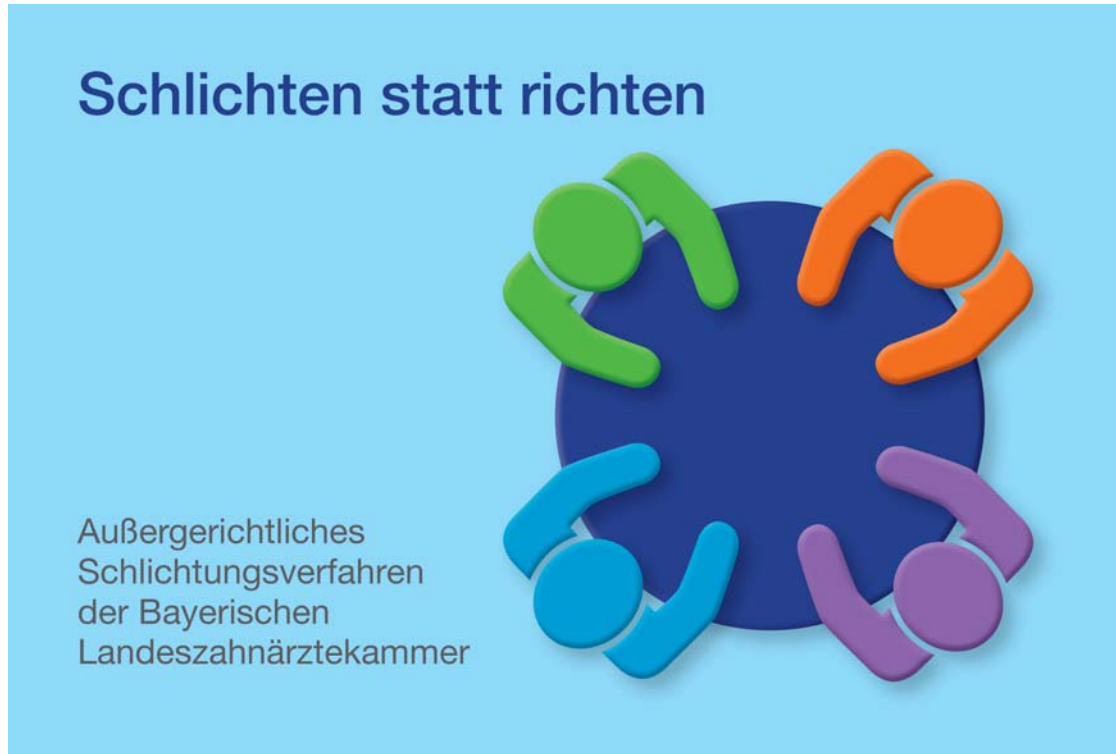
* Eine Info-Postkarte erklärt das neue Schlichtungsverfahren, das an eine Mediation angelehnt ist.

dem Behandlungsverhältnis zwischen Zahnarzt und Patient sollen geschlichtet werden. Das neue „Bay-