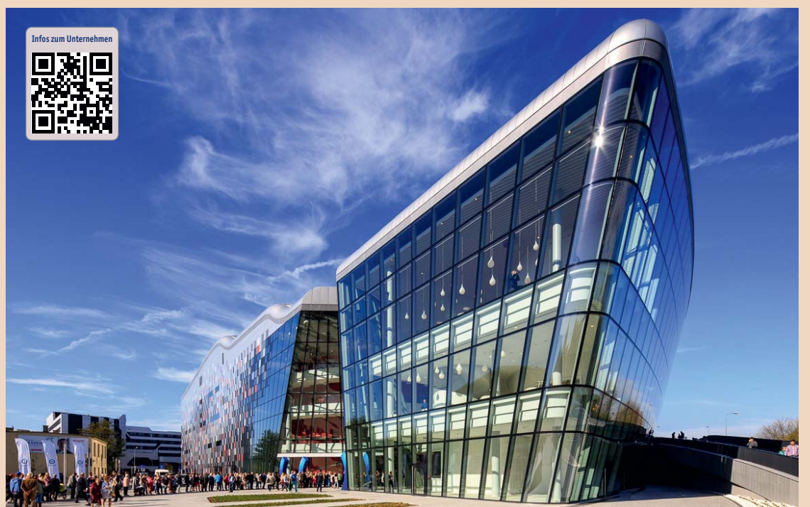
Der ideale Veranstaltungsort ist das ICE – das brandneue, moderne International Conferences and Entertainment Center.

6. Internationaler CAMLOG Kongress vom 9. bis 11. Juni 2016 in Krakau.