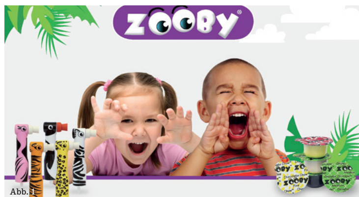
Abb.1: Zooby® sorgt für fröhliche Momente in der Praxis. Abb.2: ContactPro® Ringe von Microbrush® mit Memory-Effekt.

Diese überzeugen mit bemerkenswerter Effizienz, hervorragender Aufhellung und neutralem pH-Wert. Für die PZR bei Kindern ist die beliebte Marke Zooby® am Start. Die bunten Prophylaxeprodukte sind dekoriert mit Tieren, von A wie Alligator bis Z wie Zebra. Das sorgt für eine entspannte Atmosphäre, ermöglicht eine angstfreie Therapie und schafft eine positive Grundlage für den nächsten Besuch in der Zahnarztpraxis. Die jungen Patienten haben zahlreiche Polierpasten in beliebten Geschmacksrichtungen zur Auswahl.