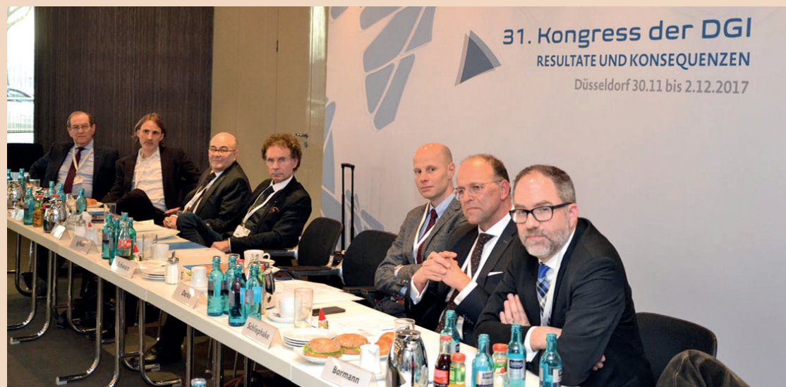
Pressekonferenz anlässlich des 31. DGI-Kongresses in Düsseldorf.

noch stark voneinander unterscheiden – vergleichbare Werkstoffstandards und Unterschiede in der Qualitätssicherung bilden damit noch eine große Herausforderung, wenn es um die Auswertung von Daten geht.