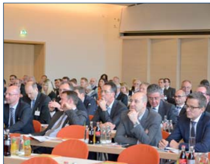
▲ Die BVD-Fortbildungstage 2013 fanden im Estrel Hotel in Berlin statt.