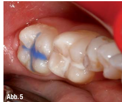
▲ Abb. 3: Die Ausgangssituation: Der Zahn 36 trägt bereits eine Versiegelung (alio loco), 37 soll versiegelt werden. ▲ Abb. 4: Der erste Schritt: Okklusalfäche und Fissur werden gründlich gereinigt, hier mit einem Occlubrush-Bürstchen. ▲ Abb. 5: Das Phosphorsäure-Ätzelgel Ultra-Etch wird appliziert. Die deutliche blaue Farbe und das thixotrope Verhalten erleichtern die gezielte Ätzung.

UltraSealXT hydro bis in die Fissuren-Tiefen „einbürsten“ und kann zugleich vermeiden, das Okklusal-Relief zuzuschwemmen (was ein späteres umfangreiches Einschleifen nötig machen würde).