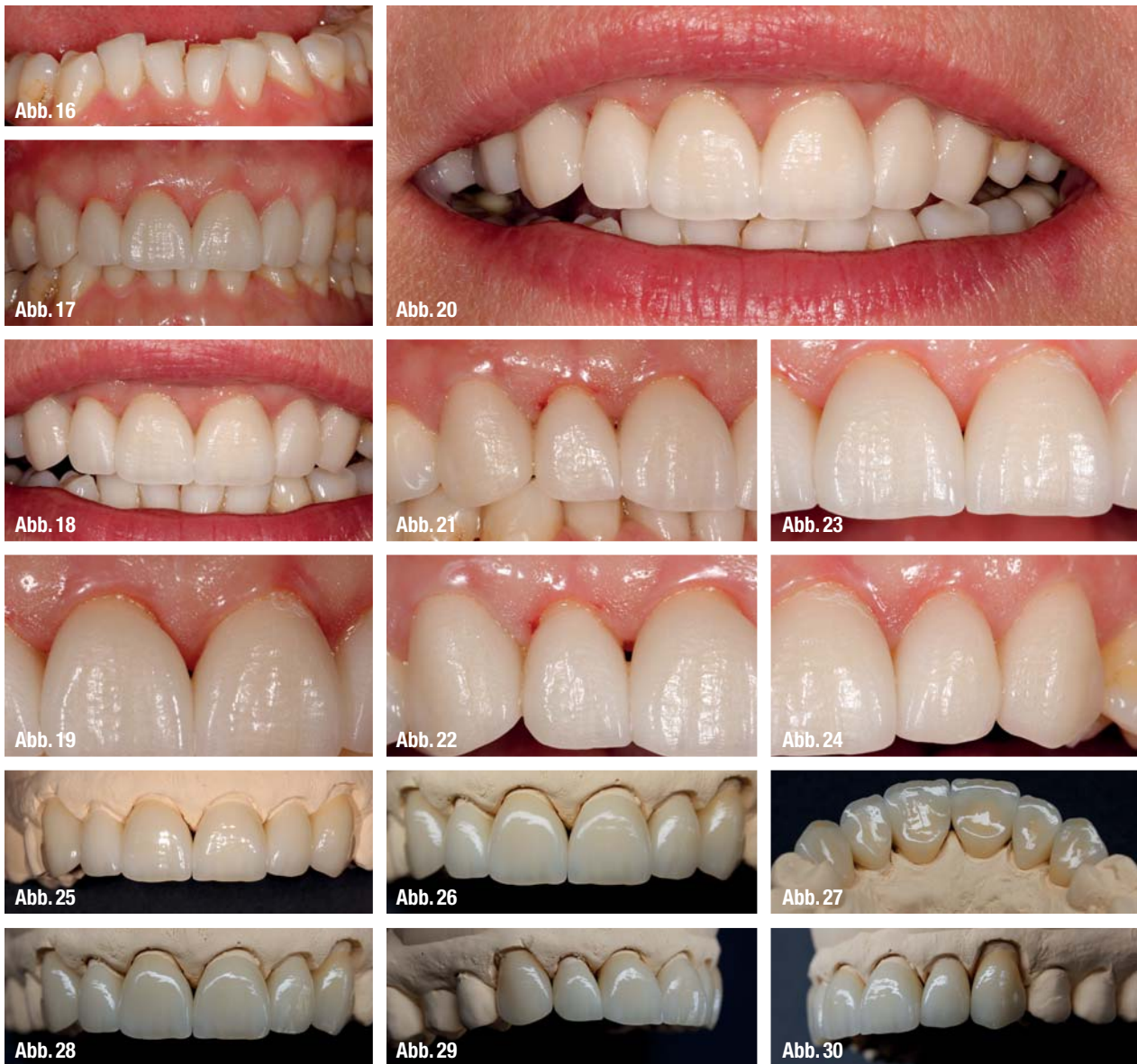
▲ Abb. 16: Detailaufnahme der UK-Front als Hilfe zum Schichten. ▲ Abb. 17–19: Rohbrandeinprobe, Kronen in situ. ▲ Abb. 20: Farbeindruck mit Einbezug der Lippen. ▲ Abb. 21–24: Kontrolle der Interdentalpapillen. ▲ Abb. 25–30: Die fertigen Kronen auf dem Kontrollmodell.

„innen“ auf die Papillen zurück (Abb. 4c und d).