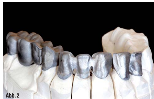
▲ Abb. 1: Aus Crypton gefertigte Brücken vom Front- bis zum Seitenzahnbereich, in diesem Fall durch ein Teilungsgeschiebe verbunden (Arbeit außerhalb der derzeit vom Hersteller freigegebenen Indikation). ▲ Abb. 2: Eine viergliedrige, eine dreigliedrige und eine zweigliedrige Brücke ergeben die komplette Rehabilitation eines ganzen Kiefers.