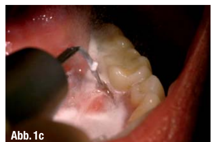
▲ Abb. 1a–c: Tigon+ in der Anwendung.