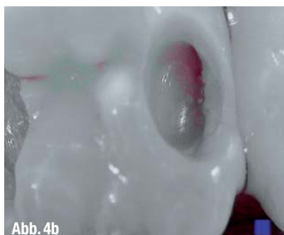
▲ Abb. 4a: Tageslicht-Modus. ▲ Abb. 4b: Karies-Modus.

handler. Wenn die Eltern bei der Fissurenversiegelung dabei sind, kann ich ihnen sehr schön zeigen, wo bei ihren Kindern evtl. Entkalkungen vorhanden sind, und ihnen erklären, warum ich dann nicht versiegeln kann bzw. man stark fluoridieren sollte. Für die Eltern ist das immer ein positives Erlebnis, da sie ihrem Kind so sonst nicht in den Mund schauen können.