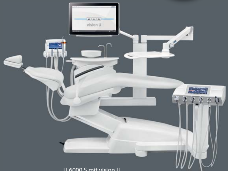
U 6000 S mit vision U

Ab sofort können Sie jede Behandlungseinheit inklusive vision U erwerben: dem revolutionären Multimedia-System in Full-HD für die Unterstützung von Hygienemanagement, Qualitätssicherung und Patientenentertainment.