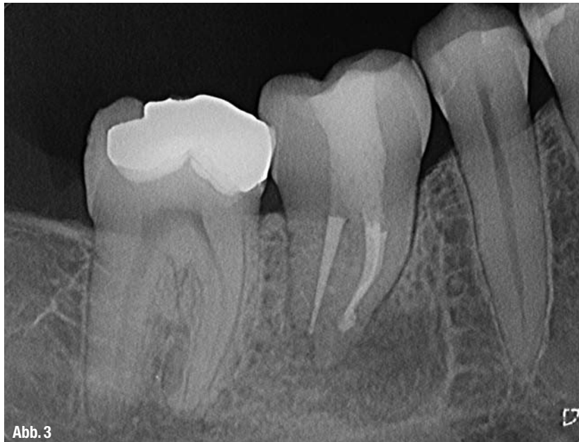
▲ Abb. 2: Röntgenmessaufnahme zur Bestimmung der Arbeitslängen. ▲ Abb. 3: Nach erfolgter Wurzelfüllung ist die Läsion weniger deutlich erkennbar.

Kanäle waren stark obliteriert und wurden nach der Hybridmethode (Hand und maschinell) aufbereitet. Nach elektrometrischen Längenmessungen erfolgte eine Röntgenmessaufnahme zur Bestätigung der Arbeitslängen (Abb. 2). Diese betragen mesial 16,0 mm und distal 17,0 mm. Im Zuge der Erweiterung der Kanäleingänge konnte mesial schließlich noch ein dritter mesiolingualer Kanal dargestellt werden. Die Aufbereitung endete mit dem Instrument ProTaper Next X3. Es erfolgte eine medikamentöse Einlage mit CaOH und einem temporären Verschluss.