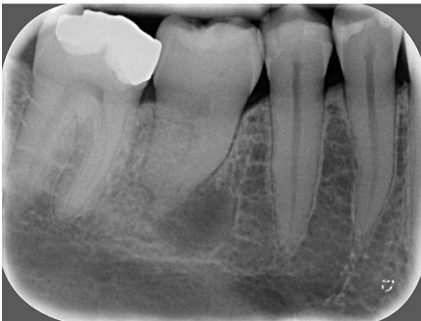
▲ Abb. 1: Röntgenaufnahme rund zehn Jahre nach Replantation des Zahnes. Es ist eine apikale Aufhellung erkennbar, die für eine chronische Parodontitis spricht.

Es erfolgte die Überweisung an uns zur endodontischen Therapie im November 2014. Am 20.11.2014 wurde die endodontische Initialbehandlung vorgenommen. Unter Lokalanästhesie und nach Legen von Kofferdam wurde zunächst eine Reinigung und Desinfektion des Zahnes und des Kofferdamtuches mit NaOCl vorgenommen. Es folgte die Trepanation und Darstellung der Pulpa-kammer unter dem Dentalmikroskop. Es konnte zunächst ein mesialer und ein distaler Kanal dargestellt werden. Die