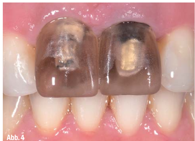
▲ Abb. 1: Ausgangssituation. ▲ Abb. 2: Präparation für die vollkeramische Neuversorgung. ▲ Abb. 3: Virtuelles Design der Frontzahnkronen. ▲ Abb. 4: Einprobe der ausgeschliffenen VITA SUPRINITY-Kronen vor der Kristallisation.