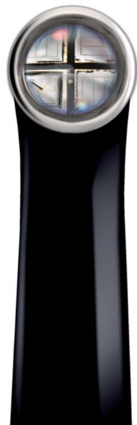
▲ Abb. 2: Die innovative Breitband-LED-Technik der VALO deckt den Wellenlängenbereich sämtlicher Composite ab.