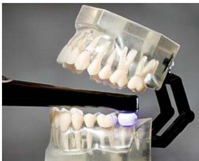
▲ Abb. 1: Durch den filigranen Kopf können mit VALO auch schwierige Areale erreicht werden, ohne dass eine extreme Mundöffnung nötig ist.

Untersucht hatte Price jeweils die Polymerisationsqualität mithilfe des 2009 von der Firma Bluelight Analytics eingeführten MARC-Systems ( M anaging A ccurate R esin C uring). Hierbei handelt es sich um eine in einem Patientensimulator eingebaute Messvorrichtung, die genaue Daten über die emittierte Lichtintensität und Wellenlänge liefert und ermittelt, wie viel Energie tatsächlich in der Kavität ankommt. Festgestellt wurde bei den Studien, dass Anwender deutlich bessere Ergebnisse bei der Aushärtung erzielten, wenn sie den empfohlenen Arbeitsanweisungen folgten und sich verstärkt auf den zu polymerisierenden Zahn konzentrierten.