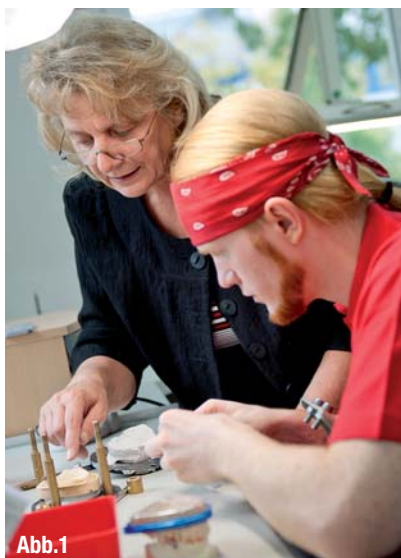
▲ Abb. 1: Junge Kollegen lernen durch den intensiven Austausch mit der Meisterin.

Kurzum, um dem Fachkräftemangel entgegenzuwirken, muss der Wandel der Arbeitsprozesse vom Auftragseingang bis zum Versand vollzogen werden. Das betrifft das ganze Team. An vielen Stellen