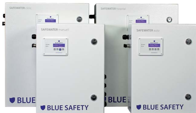
▲ Abb. 1: Dauerhaft wirksam gegen Biofilm: SAFEWATER-Systeme.

Ein erster, nicht zu unterschätzender Grund für das Eindringen von Keimen in das System liegt außerhalb der Zahnarztpraxis: Zahnärztliche Behandlungseinheiten sind in den meisten Fällen in Gebäuden untergebracht, die nicht primär für den Betrieb von Zahnarztpraxen konstruiert worden sind. Eine mögliche Verkeimung kann ihre Gründe schon im Hausnetz haben: So kann zum Beispiel eine stillgelegte Leitung abgestandenes