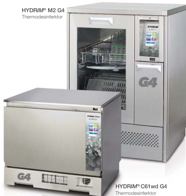
HYDRIM® C61wd G4 Thermodesinfektor