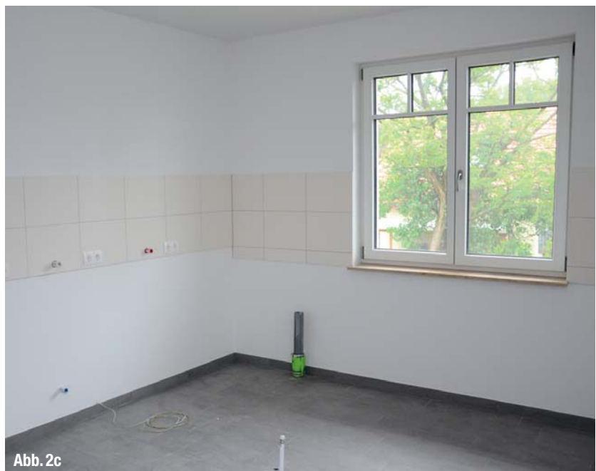
▲ Abb. 2a–c: Entstanden ist eine Laborfläche von 130 Quadratmetern, die durch klare Linien und großzügige Raumaufteilung besticht.

In der Planungsphase wurde mit dem Architekten von Henry Schein die Aufteilung und Einrichtung der Räume sowie die Anschlüsse der Absauganlage besprochen. Wir haben uns mit dem Möbelbauer im Henry Schein-Planungsbüro getroffen. Anhand der Ausstellungsstücke konnten wir dort das passende Design, Oberflächen und Materialien aussuchen. Je nach Bauphase und -fortschritt gab es dann wöchentlich oder monatlich Termine, bei denen der Architekt des Depots und mein Bauleiter Begehungen durchführten und Details besprachen.