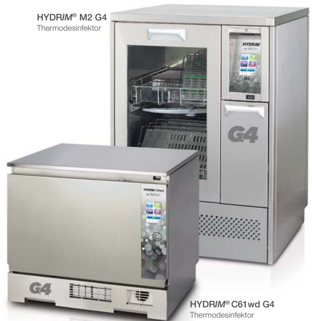
HYDRIM® C61 wd G4 Thermodesinfektor

SciCan GmbH Wangener Strasse 78 88299 Leutkirch Deutschland