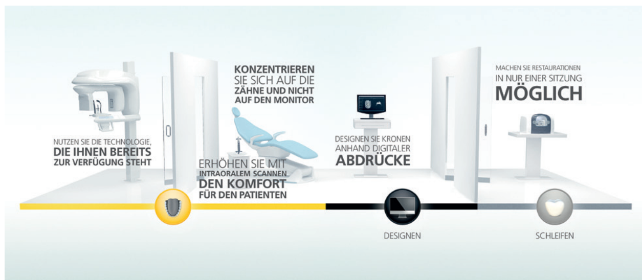
Abb. 1: Die CS Solutions-Serie von Carestream ist sehr gut aufeinander abgestimmt.

und Verblendschalen chairside in einer Sitzung 2 – und spaltete die Gemüter. So verschreckten die frühen CAD/CAM-Restaurationen aufgrund fehlender Fissuren und verhältnismäßig großer Randspalten viele potenzielle Nutzer 3 , wenngleich Langzeitstudien diesen Arbeiten eine erstaunliche Lebensdauer bescheinigen. 4 Kritische Stimmen fürchteten damals nicht nur um die Qualität der zahnmedizinischen Versorgung, sondern auch um den Untergang des Zahntechniker-Hand-