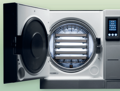
E9 Recorder Autoklav