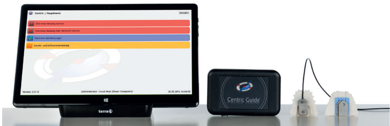
Abb. 1: Centric Guide System.

Heutzutage geht es, neben der alltäglichen zahntechnischen Arbeit, um Laborausrichtung und Positionierung. Mit welchen Leistungen können Kunden, sprich Zahnärzte, begeistert werden? Wie können neue Kunden für das Dentallabor gewonnen werden usw.? Mitunter geht es auch um die reine Existenz des Dentallabors. Dabei kann man schnell den Eindruck gewinnen, dass es nur noch zwei Gruppen von Dentallaboren gibt. Die einen, die so viel Arbeit haben und ständig auf der Suche nach guten Zahntechnikern sind, und denen, die zu wenig Arbeit haben und auf der Suche nach guten Kunden sind.