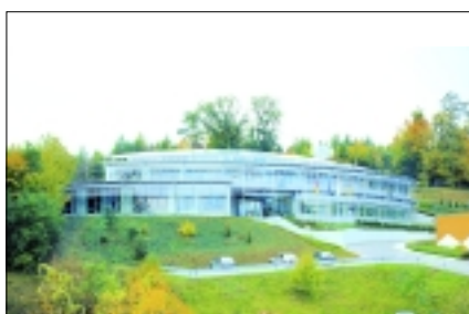
Moderne Architektur erwartet Sie auf dem Messegelände in Düsseldorf.

Eine Ablenkung der anderen Art bietet Ihnen das Motivationsspiel DentalAttack. Bei diesem actionreichen 3-D-Computerspiel, das an das bekannte Moorhuhn-Game angelehnt ist, wird derjenige Champion, der am besten Zähne putzen kann. Die Veranstalter der INFO-