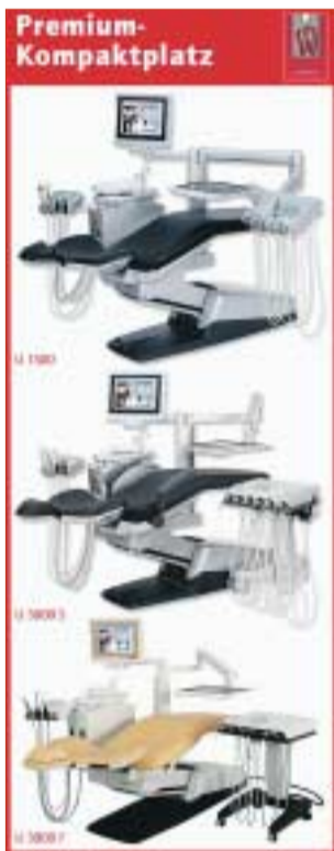
Das ULTRADENT Geräte-Konzept setzt auf neue Technologien.

Das kundenorientierte Geräte-Konzept Premium Kompaktplatz setzt auf neue Technologien, die dem Zahnarzt alle Möglichkeiten der modernen Zahnmedizin eröffnen und ihn gleichzeitig durch ergonomisches Design entlasten.