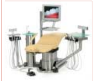
• Behandlungseinheit mit integriertem Implantologiemotor.

Bei der D1-ESplus wurde zusammen mit der Firma W&H eine Motorensteuerung entwickelt, die