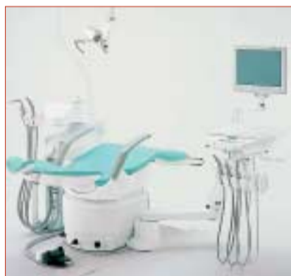
• CLESTA II – Synthese aus Tradition und Fortschritt.

Der Patientenstuhl CLESTA II ist mit dem seit Jahrzehnten bewährtem ölhydraulischen Antrieb ausgestattet. Die Vorteile sind: absolut verschleißfreie, schnelle und leise Bewegungsabläufe. Zudem maxi-