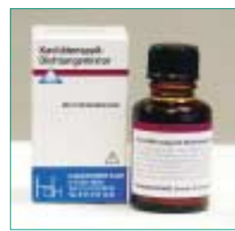
Einfaches Touchieren der Kavitäten und Stümpfe gewährleistet Sicherheit.

Dauerhaft desinfizierend und vor Erweichung des Dentins durch Anaerobier schützend erweitert sich das einfache Touchieren der Kavitäten und Stümpfe gewährleistet Sicherheit.