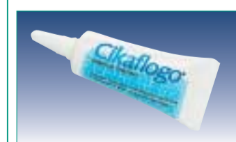
Cikaflogo – hilft schnell dank spezieller Mixtur.

Das jetzt auch in Deutschland erhältliche Gingiva-Gel Cikaflogo der Firma JaxEurope ist ein wahres Wundermittel für postopera- tive Behandlungen, Parodontose, Aphthen, Zahnfleischentzündun-