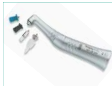
ProphyAxis Universal-Winkelstücke von W&H.

Professionelle Prophylaxe gehört heute mehr denn je zum zahnärztlichen Angebot. Neben ProphyAxis Young werden nun auch die neuen W&H ProphyAxis Universal-Winkelstü-