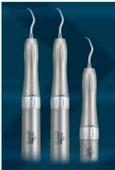
Die NSK Airscaler verfügen über drei variable Leistungsstufen.

NSK Europe steht für innovative Produkte von hoher Qualität. Getreu diesem Anspruch kann der Zahnarzt jetzt die drei neuen Airscaler S950KL, S950SL und S950L seinem Instrumentensortiment hinzufügen.