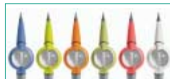
Das neue Air-Flow handy 2* in den aktuellen Farben und mit 30 Prozent mehr Leistung.

Der Air-Flow Methode ist es zu verdanken, dass Patienten die professionelle Zahnreinigung als angenehme Behandlung erleben können. Inzwischen wenden weltweit