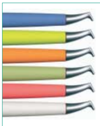
Die neuen Handstücke in modernen Farben und neu geformter Düse.

Mit den neuen farbigen Air-Flow Handstücken weht ein frischer Wind in der Praxis. In blau, gelb, orange, grün, rosé oder weiß präsentieren sie sich besonders modern. Doch nicht nur der Look ist erfrischend aktuell. EMS hat auch die Technologie der seit Jahrzehnten bewährten Pulverstrahlgeräte zur professionellen Zahnreinigung verbessert: Die neu geformte Düse hat eine größere Aktivfläche und ermöglicht dadurch einen gleichmäßigeren Reinigungseffekt als vorher. Eine innovative Düsengeometrie garantiert