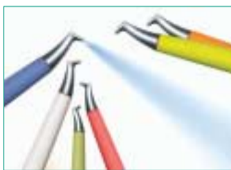
Die verlängerte Düse der Handstücke verbessert Wirkung und Präzision.

Mit den neuen farbigen Air-Flow Handstücken weht ein frischer Wind in der Praxis. In blau, gelb, orange, grün, rosé oder weiß präsentieren sie sich besonders modern. Doch nicht nur der Look ist erfrischend aktuell. EMS hat auch die Technologie der seit Jahrzehnten bewährten Pulverstrahlgeräte zur professionellen Zahnreinigung verbessert: Die neu geformte Düse hat eine größere Aktivfläche und ermöglicht dadurch einen gleichmäßigeren Reinigungseffekt als vorher. Eine innovative Düsengeometrie garantiert