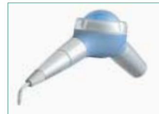
easyjet pro – Pulverstrahl für die Turbine.

Das Ultraschallgerät multi-piezo bietet verlässliche Tech-