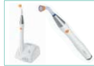
starlight pro 2 – ultraleichte LED-Polymerisationslampe.

mer gewährleistet einen absolut gleichmäßigen und leistungsstarken Pulverstrom. Das