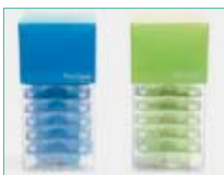
UltraEZ im KombiTray, einzeln in Blistern, 10 Stück im „Türmchen“. In der gleichen Darreichungsform: FlorOpal, ein Fluoridgel.

Patienten haben es oft schwer, die fachliche Qualität ihres Zahnarztes korrekt einzuordnen. Dazu fehlen ihnen zahnmedizinische Fachkenntnisse. Sie können jedoch sehr gut beurtei-