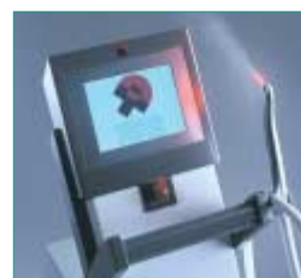
Der LD-15 i verbindet die bekannten Vorteile des seit zehn Jahren bewährten, aber stetig verbes- sertem LD-15, mit vielen neuen Innovationen.

Zur IDS 2005 stellte DENTEK Medical Systems aus Bremen den neuen LD-15 i vor. In diesem Jahr wurde das erste Mal eine Ausstellungskoope- ration mit DKL eingegangen. Die Ko- operation hat für beide Seiten neue Besucher angezogen. Auf der IDS wurden viele neue Vertriebsverein- barungen mit internationalen Händ- lern geschlossen. Ein großer Erfolg waren für DENTEK weitere Verträge mit der arabischen Welt. Somit wer- den jährlich fast einhundert LD-15 i in die arabische Welt geliefert. Auch der asiatische Markt war von dem neuen LD-15 i begeistert. Hier wurden beste- hende Verträge erweitert. Aber auch der eigentlich durch die Gesund- heitsreform totesagte deutsche Markt hat ein reges Interesse an dem neuen Laser gezeigt. Viele beste- hende LD-15 Anwender haben sich auf der Messe für einen Umstieg auf die neue Generation Diodenlaser entschieden. Somit ist der LD-15 i sei- ner Zeit wieder Schritte voraus. Für die bekannten Einsatzgebiete Pa- rodontologie, Endodontie, Chirurgie, Bleaching, Aphthen, Herpes, Biosti- mulation u. v. m. wurden wesentliche