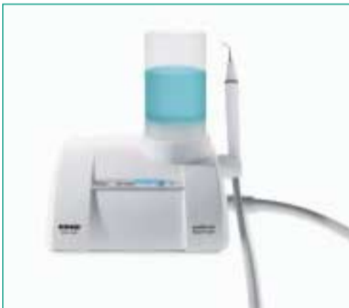
Der multifunktionale Swiss MiniMaster für alle Anwendungen und mit autonomer Wasserversorgung.

Mit dem MiniMaster steht Zahnärzten nun ein neues, multifunktionales Piezon Power Pack zur Verfügung, dessen Indikationsspektrum alle Anwendungen von der Endodontie über Perio, Scaling, Kavitätenpräparation bis hin zu konservierenden Maßnahmen umfasst. Dank der eigenen Wasserversorgung mit 350- und 500-Milliliter-Flaschen arbeitet der MiniMaster völlig autonom und benötigt zur Inbetriebnahme lediglich eine Steckdose. Dem Zahnarzt ermöglicht dies einen unkomplizierten flexiblen und mobilen Einsatz in jedem Behandlungszimmer. Das feine Wasserspray, wahlweise mit dem eigens entwickelten Desinfektionsmittel