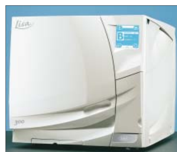
Die neue Lisa - schneller und wirtschaftlicher.

bringt das Unternehmen nun mit dem neuen Produkt ein revolutionäres Gerät auf den Markt. Die neue Lisa ist auf höchstem technischen Niveau. Forscher und Entwickler haben Jahre geprüft, probiert und getestet, um die bereits vorhandene Technologie noch weiterzuentwickeln. Ergebnis dessen ist unter anderem der neue patentierte ECO B-Zyklus und das „Air detection System“. Ersterer erlaubt die Verminderung der Arbeitszeit, indem der Mikroprozessor voll ausgenutzt wird. Der Mikroprozessor kann die Höhe der Belastung messen und optimiert die Zeiten für die Trocknungsphasen, die nötig sind, um den korrekten Sicherheitskreislauf zu be-