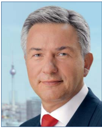
Klaus Wowereit - Regierender Bürgermeister von Berlin

Die Hallen 21 und 22 der Messe Berlin sind an diesem Sonnabend Berlins größte und modernste Zahnarztpraxis. Mein herzliches Willkommen gilt den Besucherinnen und Besuchern der BERLINDENTALE 2009.