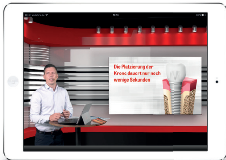
Als brandneues Produkt kommen jetzt die (Live-)Studio-Tutorials auf den Markt.