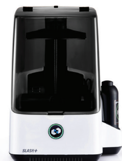
Printer 3D Slash+