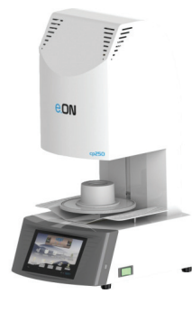
Ugin Dentaire E.ON CP 200