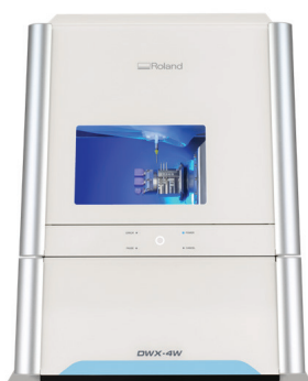
Roland DWX-4W cu compresor MGF