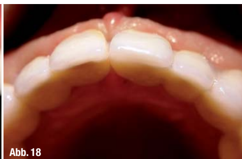
Abb. 16_ Langzeitprovisorium in situ. Abb. 17_ Vorläufiges ästhetisches Endergebnis mit Langzeitprovisorium. Abb. 18_ Stabiles Volumen im Bereich des Augmentates nach sechs Monaten, Schluss des Trema und Reduktion des Deckgebisses.