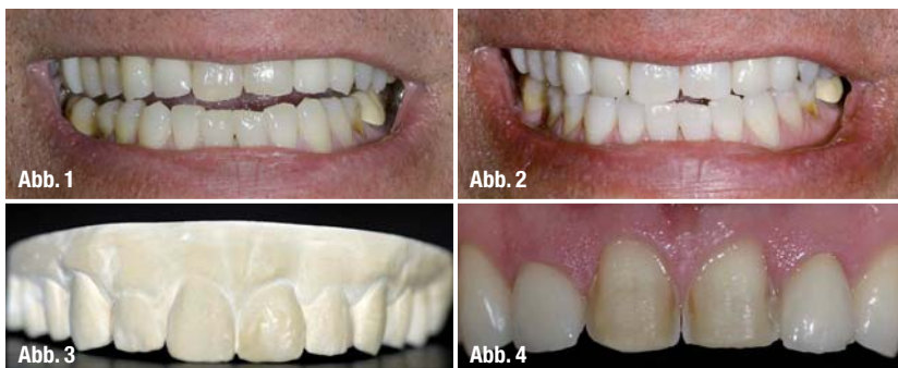
Abb. 4 _ Präparationen.