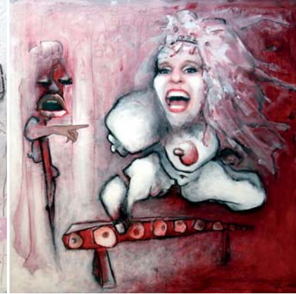
Sie hätte vorher schon fragen müssen