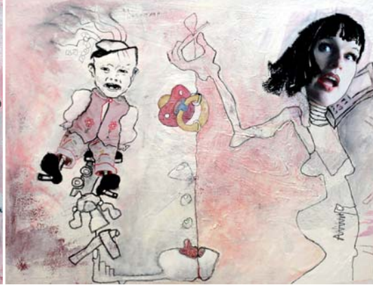
Wie machen wir jetzt den Mann für Töchter?