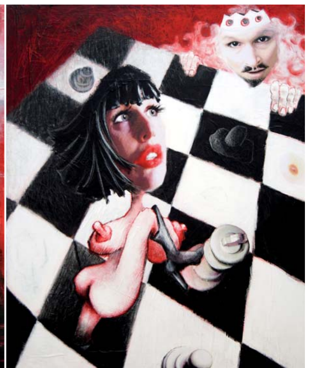
Heute ist die Krone fällig