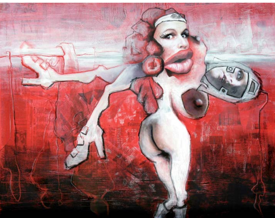
Frauenbild zu entsorgen