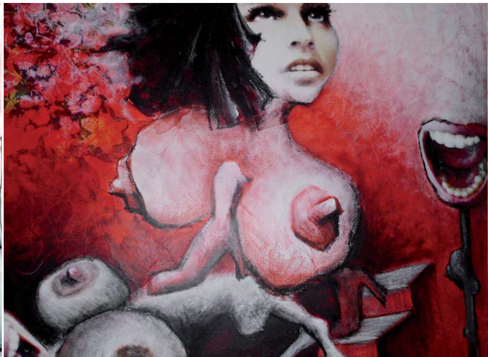
Frau Mentor und der Weg ins Glück