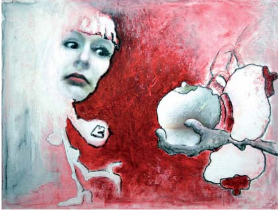
Das Geschenk der Mutter