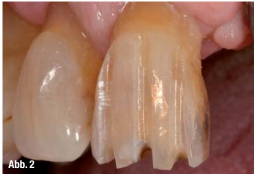
Abb. 2_ Eine einheitliche Präparation kann erzielt werden, indem vertikale Orientierungsrillen mit gleicher Breite, die den Durchmesser des Diamantschleifers nicht überschreitet, angelegt werden. Die Kontrolle der einheitlichen Reduktion erfolgt mit einem vorab erstellten Silikonschlüssel.