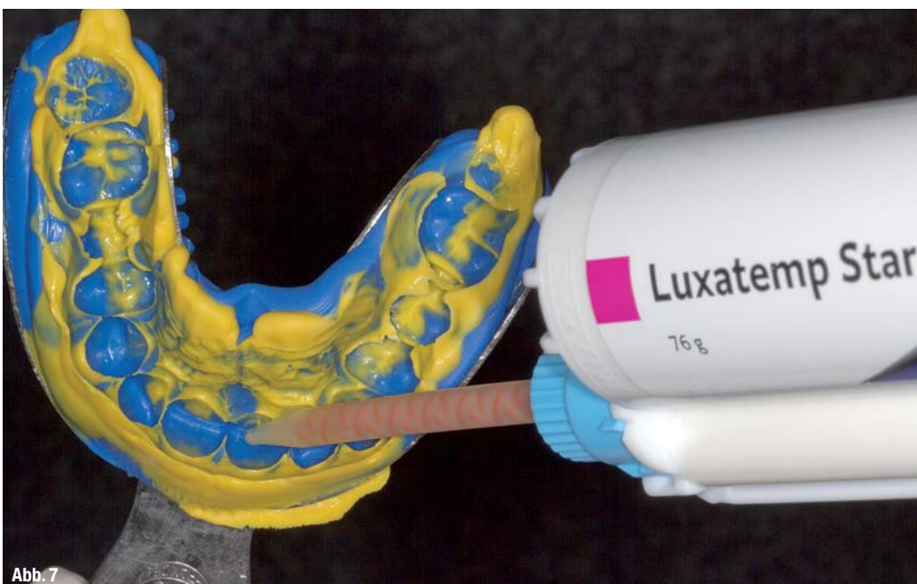
Abb. 7 Vom Wax-up wurde mit Doppelmischabformung ein präzises Negativ angefertigt. Das Komposit (Luxatemp Star, DMG) wird in die Abformung appliziert, bevor es zur Erstellung eines Positivs und somit des Mock-ups im Mund reponiert wird. Nach der Polymerisation kann das ästhetische Erscheinungsbild umgehend auch vom Patienten beurteilt werden. Aufgrund der variablen Stärke und der damit verbundenen Bruchgefahr des Komposits sollte das Mock-up zunächst nicht entfernt werden. Auf die Verwendung von Haftvermittlern sollte allgemein bei dieser Methode verzichtet werden.

Die indirekte Methode der kontrollierten Eindringtiefe ist unabhängig vom behandelnden Zahnarzt. Sie gewährleistet eine kontrollierte Eindringtiefe und eine hohe Reproduzierbarkeit bei der Präparation, hat jedoch auch ihre Grenzen. In bestimmten Fällen weisen ein oder mehrere Zähne eine erhebliche Fehlstellung auf, was somit zu gravierenden Abweichungen vom natürlichen Zahnbogen führt. Hier ist es oftmals unumgänglich, diese Zähne zuerst zu präparieren und zu reduzieren, bevor das Mock-up hergestellt werden kann. Dadurch wird verhindert, dass bei der Erstellung des Silikonschlüssels oder der Miniplastschiene Zähne erheblich aus dem Mock-up herausragen oder zu einer Deformation des Mock-ups führen. Um eine perfekte Platzierung des Schlüssels und somit des späteren Mock-ups auf den Zähnen zu gewährleisten, sollte zu Beginn der Präparation mit dem Silikonschlüssel überprüft werden, ob die anfängliche Reduktion auch tatsächlich ausreichend ist. Für die Labialflächen ist diese Methode vollständig