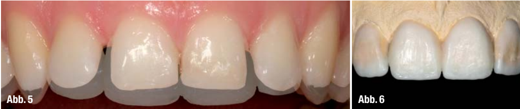
Abb. 5 Die ästhetische Analyse und die Wünsche des Patienten indizieren eine Versorgung mit keramischen Verblendschalen (Veneers). Mithilfe eines Komposits, das freihändig auf die Labialflächen aufgetragen wird, können wesentliche Veränderungen direkt am Patienten ermittelt und gemeinsam mit ihm abgestimmt werden. Um die Verkürzung der Eckzähne zu simulieren, werden zu lange Zähne mit einem schwarzen Filzstift markiert. Durch die Überlagerung der Bilder wird der ästhetische Vorteil durch die Beseitigung der Zahnlücke und die Neuausrichtung der Schneidezähne veranschaulicht. Anschließend erfolgt eine erste orientierende Abformung zur Herstellung eines diagnostischen Modells mit Wax-up.