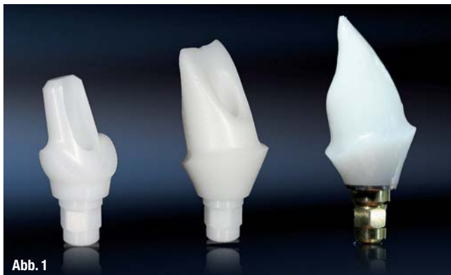
Abb. 1 Varianten von Zirkon-Implantataufbauten von links nach rechts: Konfektioniert einteilig (CERCON®); CAD/CAM einteilig und CAD/CAM zweiteilig/Titan-Klebbasis (Compartis®). Abb. 2 Computer-aided design und fertig verklebtes, zweiteiliges CAD/CAM Zirkonabutment auf Titan-Klebbasis.