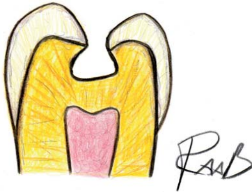
Abb. 1 Die Adhäsivpräparation.

„Durch eine Verbesserung der Adhäsivtechnik ist es inzwischen möglich, auch größere Kavitäten im Seitenzahnbereich mit ästhetisch ansprechenden zahnfarbenen plastischen Füllungsmaterialien ästhetisch und langfristig zu versorgen (Manhart 2004, DGZMK 2005). Besondere Bedeutung für eine lange Haltbarkeit und hohe Ästhetik stellen dabei – neben einer adäquaten Indikationsstellung – die folgenden Arbeitsschritte dar: