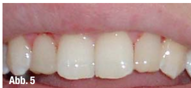
Abb. 5_ Mit der Adhäsivtechnik aufgebaute Zapfenzähne an den Zähnen 12 und 22.

größerung durch Phosphorsäure dar. Während bei Adhäsivsystemen der 3. Generation lediglich eine Schmelzätzung (Buonocore 1955) erfolgte, wird bei Adhäsivsystemen der 4. und 5. Generation sowohl die Schmelz- als auch die Dentinoberfläche durch Phosphorsäure vergrößert (Total Etch). In Adhäsivsystemen der 6. Generation aufwärts ist der Conditioner bereits im Adhäsiv enthalten (selbstkonditionierende, selbstprimende Adhäsive). Allerdings ist die Haftkraft der selbstkonditionierenden, selbstprimenden Adhäsive noch nicht so hoch wie die der Adhäsivsysteme der 5. Generation (Frankenberger und Tay 2005). Es sollte daher zurzeit noch einem Adhäsivsystem der 5. Generation der Vorzug gegeben werden. Dabei hat es sich bewährt, den Zahn mit einem 37%igen Phosphorsäure-Gel vorzubereiten (Ohsawa 1971, Ohsawa 1972). Säurekonzentrationen über 40 % führen zur raschen Präzipitation von Kalziumphosphatverbindungen, die eine Konditionierung des Zahnschmelzes behindern. Säurekonzentrationen unter 30 % führen zur Ablagerung von schwer löslichem Brushit auf dem Zahnschmelz, wo-