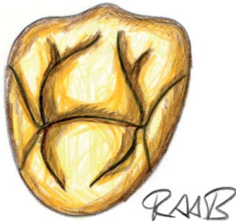
Abb. 4_ Mögliche Kauflächen- gestaltung eines Prämolaren.

größerung durch Phosphorsäure dar. Während bei Adhäsivsystemen der 3. Generation lediglich eine Schmelzätzung (Buonocore 1955) erfolgte, wird bei Adhäsivsystemen der 4. und 5. Generation sowohl die Schmelz- als auch die Dentinoberfläche durch Phosphorsäure vergrößert (Total Etch). In Adhäsivsystemen der 6. Generation aufwärts ist der Conditioner bereits im Adhäsiv enthalten (selbstkonditionierende, selbstprimende Adhäsive). Allerdings ist die Haftkraft der selbstkonditionierenden, selbstprimenden Adhäsive noch nicht so hoch wie die der Adhäsivsysteme der 5. Generation (Frankenberger und Tay 2005). Es sollte daher zurzeit noch einem Adhäsivsystem der 5. Generation der Vorzug gegeben werden. Dabei hat es sich bewährt, den Zahn mit einem 37%igen Phosphorsäure-Gel vorzubereiten (Ohsawa 1971, Ohsawa 1972). Säurekonzentrationen über 40 % führen zur raschen Präzipitation von Kalziumphosphatverbindungen, die eine Konditionierung des Zahnschmelzes behindern. Säurekonzentrationen unter 30 % führen zur Ablagerung von schwer löslichem Brushit auf dem Zahnschmelz, wo-