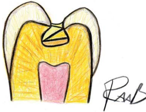
Abb. 3_ Schichttechnik; das Kompositmaterial wird in dünnen Schichten aufgetragen und Schicht für Schicht separat ausgehärtet.

Ob eine Unterfüllung unter einer adhäsiv verankerten Kompositfüllung notwendig ist, wird zurzeit kontrovers diskutiert. Argumente gegen eine Unterfüllung sind z. B. der höhere Zeitaufwand, die Verkleinerung der zur Verfügung stehenden Haftfläche oder die Vermutung, dass Adhäsivsysteme nicht unbedingt pulpatoxischer seien als Unterfüllungsmaterialien (González-López und Bolaños-Carmona 2005, Fujitani et al. 2002, Costa et al. 2003, Lu et al. 2006). Auch wenn bei einigen Patienten durchaus sogar eine direkte Pulpaüberkappung mit Dentinadhäsiven erfolgreich