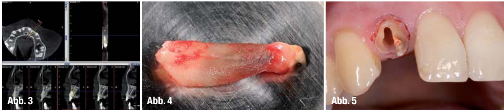
Abb. 3_ DVT Fall 1.