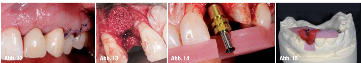
Abb. 12 Nahtverschluss Fall 1 mit vertikaler Entlastungsinzision distal des ersten Prämolaren und dem Verschluss des Papillenbasisschnitts bei 23.

Die Nahtentfernung erfolgt sieben Tage nach Implantation bei reizlosen Wundverhältnissen. Grundsätzlich spielt die Implantatposition für ein erfolgreiches ästhetisches Ergebnis eine entscheidende Rolle. 1 Die vertikale Einbringtiefe des Implantates richtet sich nach der Schmelz-Zement-Grenze des korrespondierenden Frontzahnes. Bei Systemen ohne Plattform-Switch sollte die Implantatschulter 2–3 mm unterhalb dieser Grenze liegen. Bei Systemen mit Plattform-Switch, muss die Implantatschulter etwas tiefer platziert werden und ca. 3–4 mm von der Schmelz-Zement-Grenze entfernt sein.