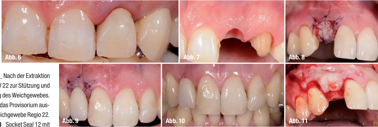
Abb. 6 Nach der Extraktion eingesetztes PV 22 zur Stützung und Ausformung des Weichgewebes.