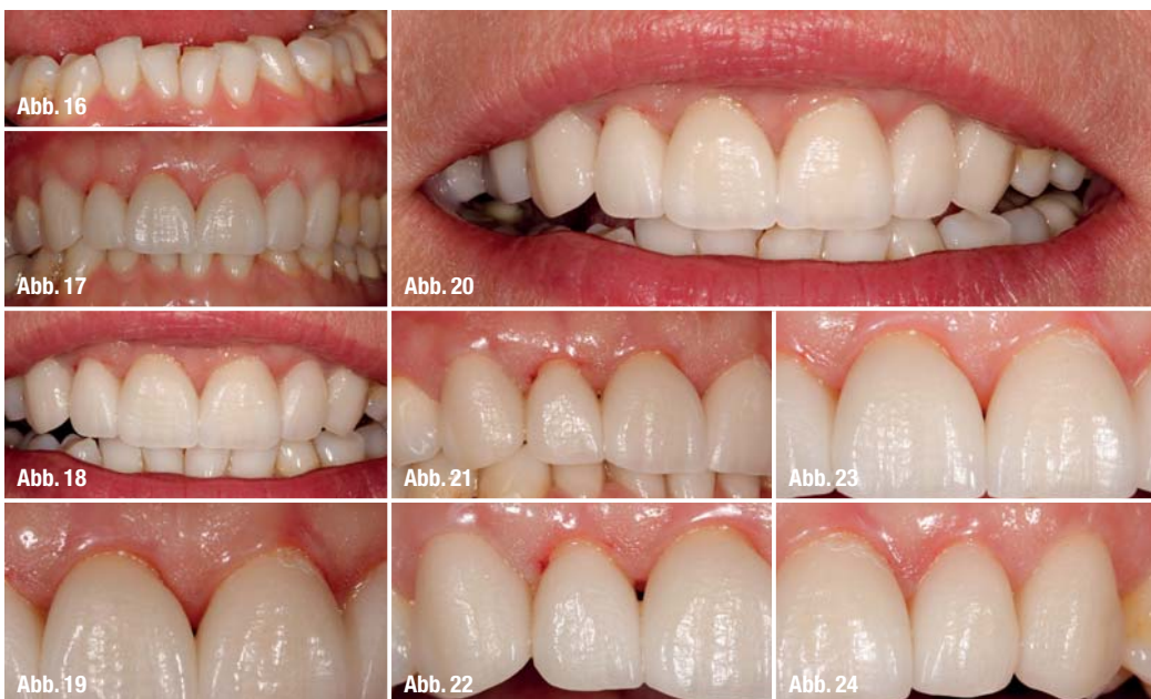
Abb. 16_ Detailaufnahme der UK-Front als Hilfe zum Schichten. Abb. 17–19_ Rohbrandeinprobe, Kronen in situ. Abb. 20_ Farbeindruck mit Einbezug der Lippen. Abb. 21–24_ Kontrolle der Interdentalpapillen.

alle Richtungen gestreut und strahlt somit auch von „innen“ auf die Papillen zurück (Abb. 4c und d). Der zweite Grund für Verfärbungen der Gingiva bei angrenzenden Metallkeramikronen ist, dass sich Metalloxide aus den unedleren Metallen der Legierung herauslösen und in das angrenzende Weichge-