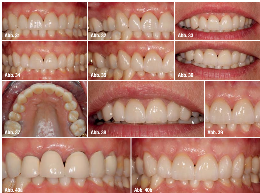
Abb. 40a und b_ Vorher-Nachher-Situation im Vergleich.