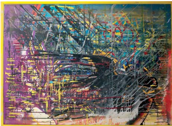
Der letzte Samurai, 140 x 100 cm

Die Kunst bietet so viele hilfreiche Erkenntnisse und Weisheiten, dass sie weitaus wichtiger sein sollte, als die Gesellschaft ihr eingesteht. Die Reflexionen, die durch die kreative Arbeit entstehen, sind kleinste Gedanken, die die Welt besser und liebevoller machen. Also lasst den Malenden, Singenden, Schreibenden und allen anderen fantasievollen Wesen den Platz, zu sein, wer sie sind – Farbtupfer auf der Straße.