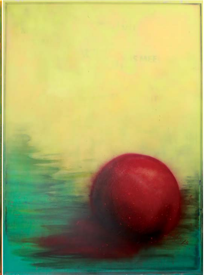
Verkannte Harmonie, 100 x 140 cm

ist für mich kein banales Darstellen von Gefühlen, denn wer versucht, Gefühle geplant darzustellen, vergisst sie einfach zu fühlen. Vielmehr passieren die Dinge unbewusst. Und doch gewollt, wenn ein Gedanke den Weg durch die Nervenbahnen bis auf die Leinwand bestreitet. Die Malerei geschieht einfach. Es sollen keine Grenzen geschaffen werden. Zeit spielt keine Rolle. Und ein „schön“ und „hässlich“ kann es nie geben. „Zufriedenheit braucht keine Perfektion.“ Meine Bilder sind kunterbunte und tiefe Gedanken, die den Betrachter in eine,