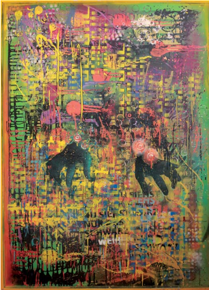
Sinfonie des Lebens, 100 x 140 cm