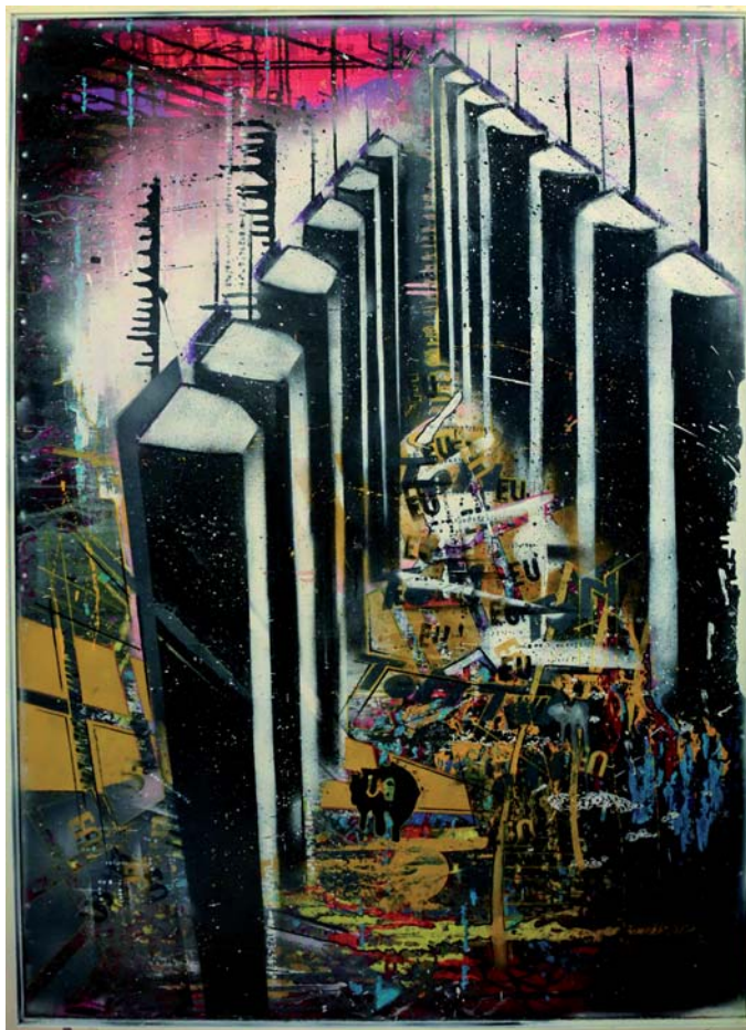
Kampf der Oktaven, 100 x 140 cm

Der Weg ist das Ziel, der Stift der Akteur, die Tinte ist der Fluss der Kreativität. Irgendwie spielt alles eine Rolle und irgendwie ist alles doch irrelevant. Insbesondere dann, wenn man selbst nicht frei, nicht bereit und auch nicht aufnahmefähig ist. Für alle Sachen, die es zu kaufen gibt, gibt es die MasterCard. Für alle bunten Blaupausen die Muse. Nachts setzt sie mir Ideen in den Kopf. Die Malerei