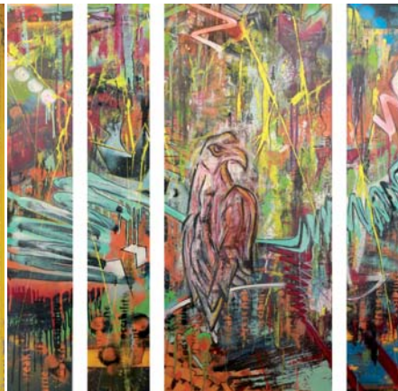
Augen der Lüfte, 140 x 120 cm