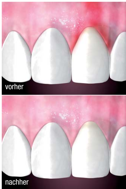
Die Anwendung von PERIOSYAL ® SHAPE im Vorher-Nachher-Vergleich.

ner Hebung des Zahnfleisches. Die Ergebnisse sind nach 1–3 Wochen sichtbar. Für beide Produkte wird die Technologie des Resilient Hyaluronic Acid ™ genutzt. Das Gel steigert Wundheilungsprozesse, besitzt eine hohe Kohäsivität und ist optimal kreuzvernetzt, verbindet sich dadurch mit dem umliegenden Gewebe und verlängert den Effekt der Behandlung.