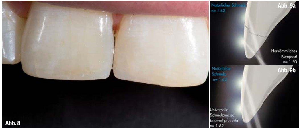
Abb. 9 a und b: _Der Lichtbrechungsindex von Enamel plus HRI entspricht dem des natürlichen Schmelzes.

Die Lichtbrechung sowie -reflexion und die ästhetische Wirkung entsprechen dem des natürlichen Zahnes. Die so versorgten Patienten sind in den meisten Fällen sehr zufrieden und dankbar, dass wir eine Alternative zum Keramikveneer oder gar einer Überkronung vorgeschlagen haben. Das heißt nicht, dass Keramikversorgungen nicht mehr gebraucht werden; ganz und gar nicht. Nur: das Indikationsspektrum für Kompositrekonstruktionen hat sich erheblich erweitert, ganz abgesehen von der Bequemlichkeit sowie dem Kosten-Nutzen-Aufwand für den Patienten und nicht zuletzt den Verdienstmöglichkeiten für den Zahnarzt. Das Komposit Enamel plus HRI ist der bisher einzige Vertreter einer neuen Klasse hochästhetischer Restaurationsmaterialien. Das Besondere und Einzigartige liegt in der Angleichung des Lichtbrechungsindex an den Wert des natürlichen Schmelzes, er beträgt 1,62 (Abb. 9a und b).