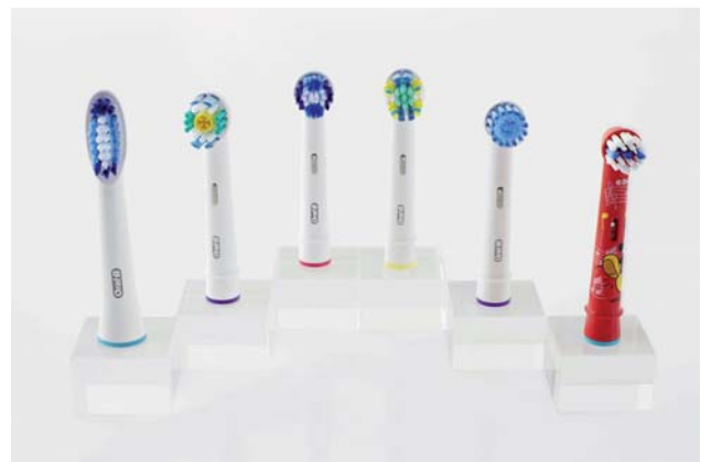
Abb. 1: Der richtige Bürstenkopf für jeden Patienten: Alle gängigen Aufsteckbürsten von Oral-B passen auf sämtliche oszillierend-rotierende Oral-B-Handstücke.

ratungsgespräch – verbunden mit einer Empfehlung von individuell geeigneten Hilfsmitteln. Im Vordergrund steht naturgemäß die Zahnbürste, wobei ein elektrisches Modell für die Mehrzahl der Patienten von Vorteil ist. So zeigen viele klinische Studien die Überlegenheit der elektrischen Zahnbürste mit kleinem, runden Bürstenkopf, die geometrisch genau definierte oszillierende Rotationsbewegungen ausführt. In Kurz- bzw. Langzeitstudien wurden für diese eine gründlichere Plaqueentfernung bzw. eine bessere Gingivitisreduktion als für die Handzahnbürste festgestellt. 1,2 Das reichhaltige Angebot an Aufsteckbürsten erlaubt eine auf den einzelnen Patienten zugeschnittene Auswahl (z.B. Oral-B Precision Clean, Oral-B Tiefen-Reinigung, Oral-B 3D White, Oral-B Sensitive, Oral-B Ortho Care Essentials; Abb. 1 und 2).