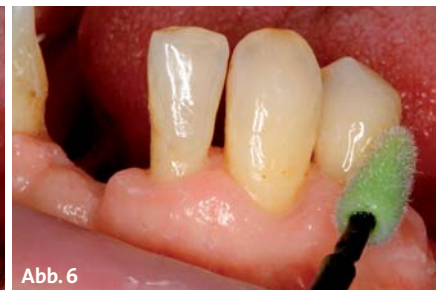
Abb. 3: Schonende professionelle Reinigung mit einer bimssteinfreien Prophy-Paste. – Abb. 4: Gezieltes Auftragen eines chlorhexidinhaltigen Schutzlacks bei der Implantatversorgung. – Abb. 5: Applikation einer feinen Schicht von Cervitec Plus mit Chlorhexidin. – Abb. 6: Nach kurzem Trocknen des chlorhexidinhaltigen Lacksystems Applikation des Fluoridlacks Fluor Protector.