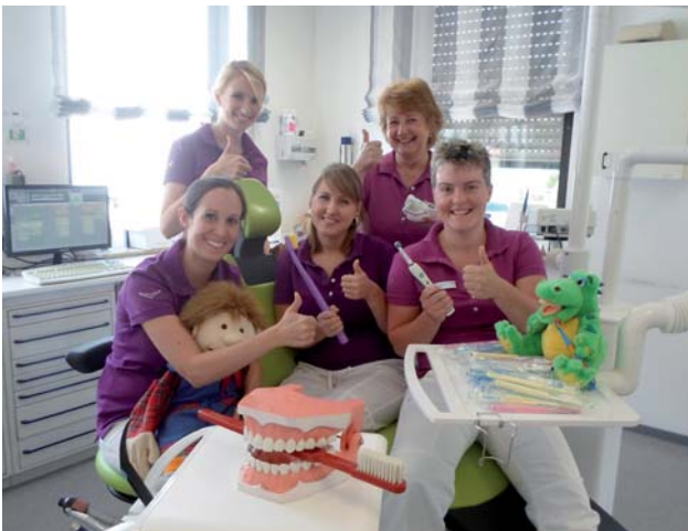
Abb. 1: Das Team der „Praxis für Zahnheilkunde Mauer“.

■ Wir als Zahnarztpraxis beteiligen uns an den verschiedenen Sammelprogrammen von TerraCycle – besonders erfolgreich sind wir beim Sammeln von Zahnhygieneartikeln wie alten Zahnbürsten oder leeren Zahnseidedöschen für das Colgate Sammelprogramm. Pro Abfalleinheit, die wir an TerraCycle schicken, werden uns Punkte gutgeschrieben, die wir in eine Bargeldspende für ein gemeinnütziges Projekt umwandeln können.