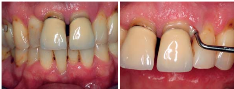
Abb. 4: Klinisches Bild eines parodontal und kariogen geschädigten Gebisses mit deutlich sichtbarem Attachmentverlust. – Abb. 5: Klinisches Bild mit pathologischer Sondierungstiefe und Pusaustritt aus der parodontalen Tasche.

prophylaktische Mundhygienemaßnahmen unschädlich gemacht werden. In tiefen parodontalen Taschen mit einem hohen Attachmentverlust findet man vor allem hochpathogene gramnegative anaerobe Keime mit hohem destruktivem Potenzial an Hart- und Weichgewebe wie vom Typ Aggregatibacter actinomycetemcomitans (A.a.c), Porphyromonas gingivalis (P.g) und Bacteroides forsythus (B.f).