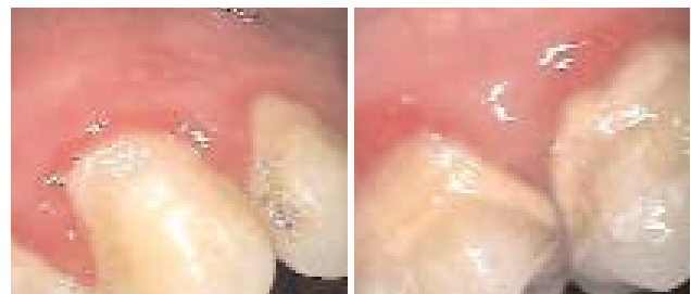
Abb. 1 und 2 (Intraoralkamera-Aufnahmen): Klinisches Bild des supragingivalen Biofilms mit Entzündungszeichen des umliegenden Gewebes.

Supragingivale Plaque unterscheidet sich zudem gravierend von der subgingivalen Plaque. Im supragingivalen Biofilm leben die Bakterien organisiert und können den Biofilm über die Mundhöhle verlassen, haften direkt an der Zahnoberfläche an und verlieren durch die richtigen Mundhygienemaßnahmen ihre Wirksamkeit. Der subgingivale Biofilm kann leider nicht durch einfache