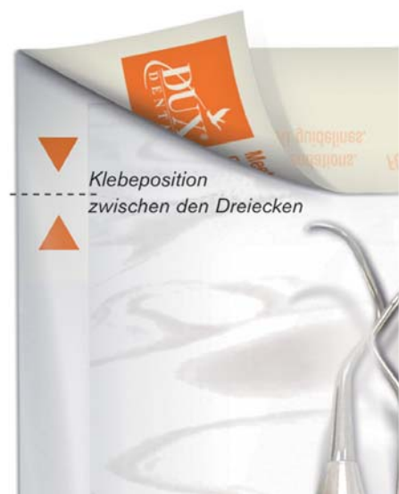
Abb. 1: Validierbare Selbstklebebeutel PeelVue+.– Abb. 2: Schließ-Validatoren geben die exakte Klebposition der Verschlusslasche vor.