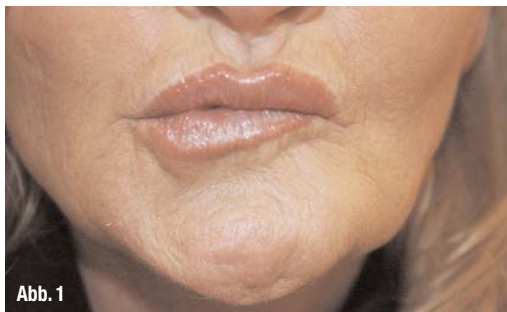
Abb. 1 14 Tage nach BTX-Injektion perioral – die Patientin versucht einen „Kussmund“ zu machen.